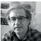
Giorgio Pupella Odradek / Compagnie Pupella-Noguès