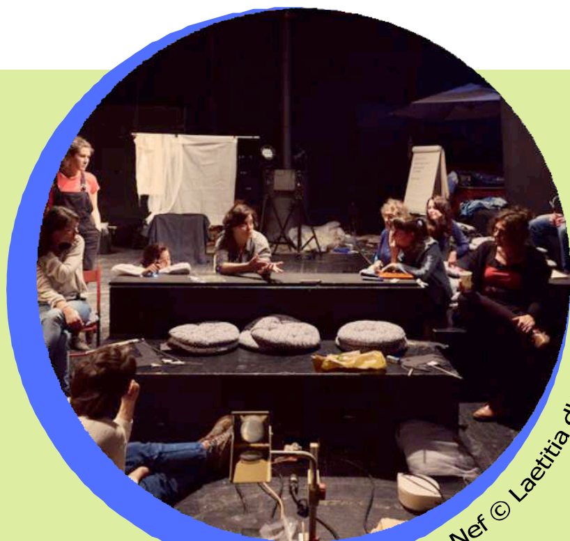
La Nef