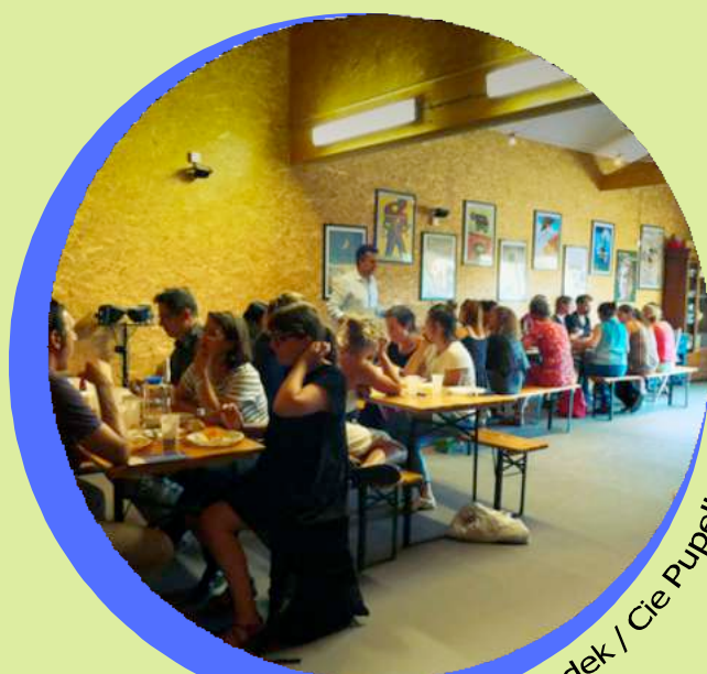
Odradek / Cie Pupella Nogues