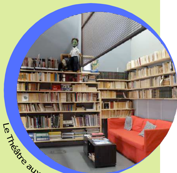
Le Théâtre aux Mains Nues