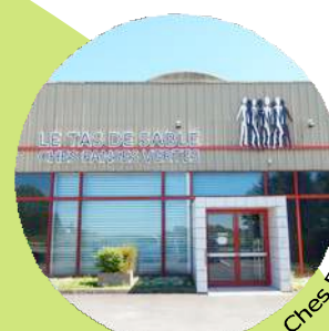
Le Tas de Sable - Ches Panse Vertes