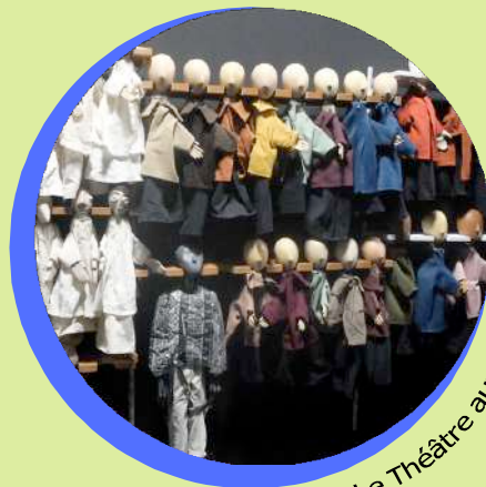
Le Théâtre aux Mains Nues