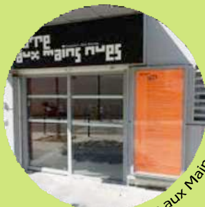
Le Théâtre aux Mains Nues