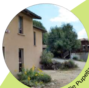
Odradek / Cie Pupella Nogues