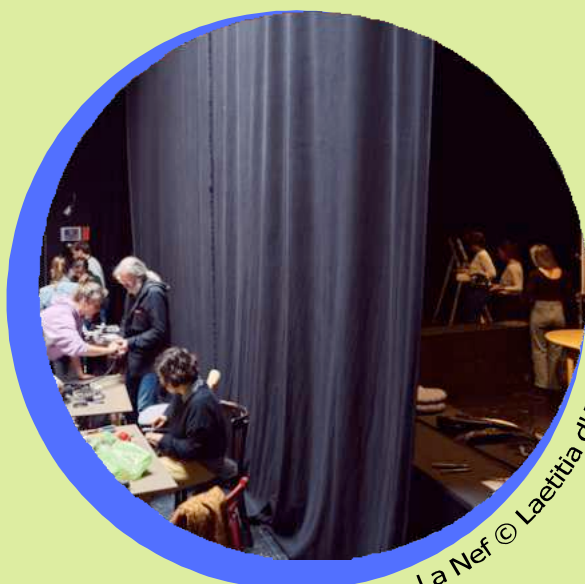
La Nef