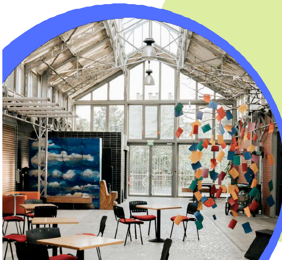
Théâtre Halle Roublot

● Transmission artistique : Une attention particulière est portée à l'accueil de jeunes artistes ou équipes artistiques ayant finalisé leur formation initiale, dans une démarche de soutien à leur insertion professionnelle. Mais le compagnonnage peut s'adresser à tout artiste qui en exprime le besoin dans le cadre d'une évolution de son parcours. Dans tous les cas, le compagnonnage a pour objectif la transmission d'un art, d'une histoire d'une compagnie/d'un lieu et du métier de marionnettiste.