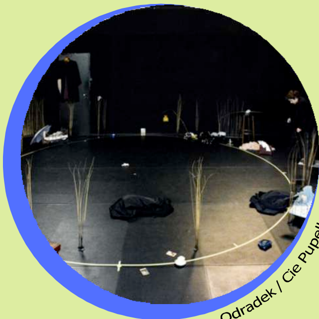
Odradek / Cie Pupella Nogues