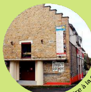
Le Théâtre à la coque