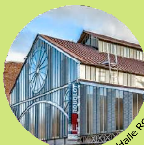
Théâtre Halle Roublot