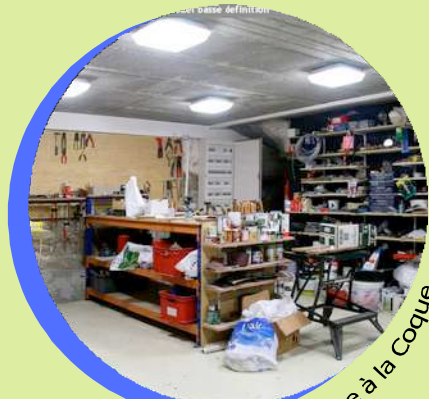
Le Théâtre à la Coque