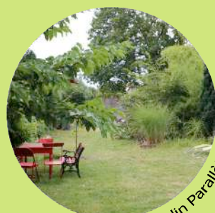
Le Jardin Parallèle