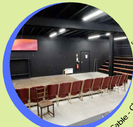
Le Tas de Sable - Ches Pansees Vieilles